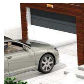
Porte de garage